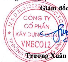
Trương Xuân Phúc